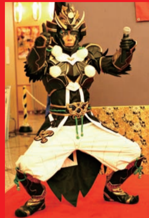
「バツ、テン、グ〜ッ！」のコールも日に日に大きく(7/21、龍宮城スパホテル三日月)