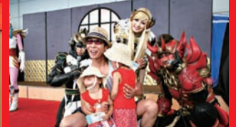
ヤツルギ3のショーを初お披露目。初対面の鬼丸に驚いちゃう子ども…(7/14、アリオ蘇我)