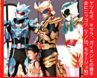
ヤツルギ、キサラ、ガイオンとの握手会にニコニコ(7/15、モリジョウ)