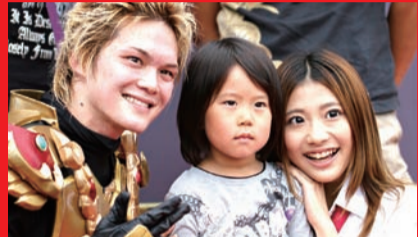
タケルもヤツルギに変身し、熱いアクションを披露してくれたぞ！(7/22、ミハマ・ニューポート・リゾート)